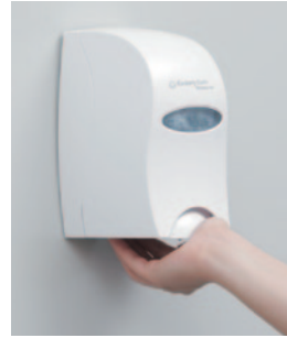
ウインドウズ ハンドソープ 500mlディスペンサー (エービー・HSG用)