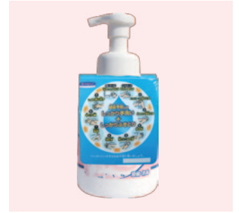
ハンドソープボトルにかけて正しい衛生習慣を身につけましょう。